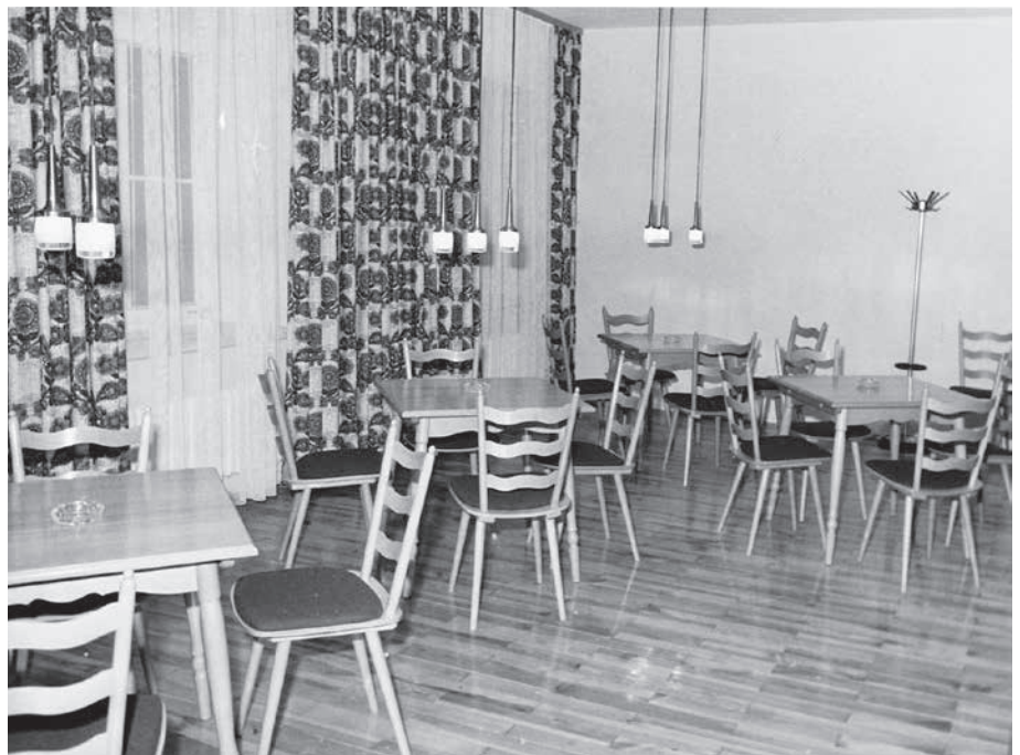
Die erste Einrichtung der HDO-Gaststätte 1970

ligen Kost wurden ins Fluchtgepäck gesteckt. Ergänzt wurden die Kochbuchsammlungen in der Nachkriegszeit durch die bunten Broschüren von Firmen, die, ihre eigenen Produkte verwendend, Rezepthefte herausgaben. Ein typisches Beispiel hierfür war die Firma Müller 5 Karlsbader aus Neutraubling (Bild linke Seite unten).