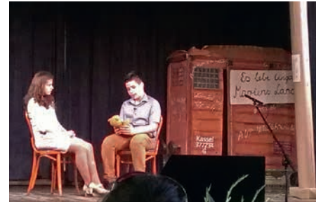
Die Geschichte vom Teddybären – im Hintergrund ein selbst gebauter Zug als Symbol für die Vertriebenen Transporte aus Ungarn

„Es kann sich heute kein Mensch mehr vorstellen, was die ungarndeutsche Bevölkerung nach dem Zweiten Welt-