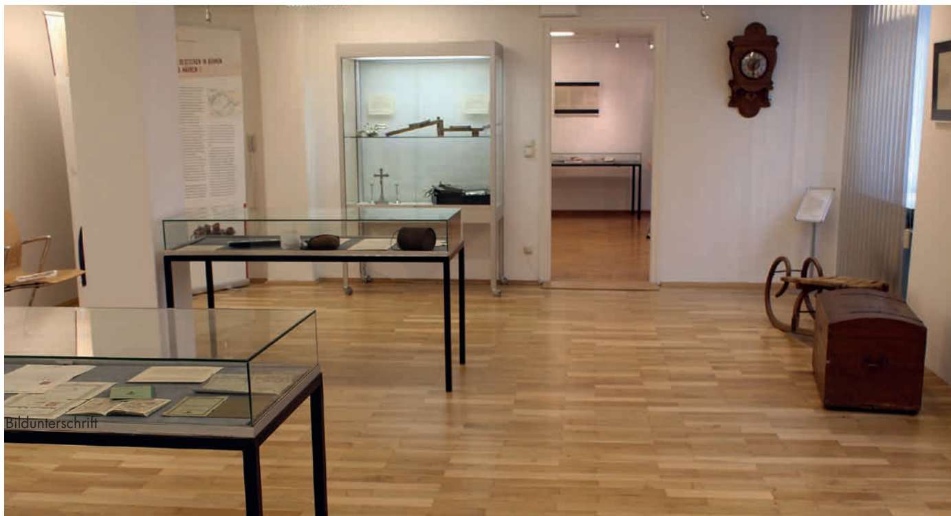
Blick in die Ausstellung

portationen, Aussiedlung und Spätaussiedlung sowie ein Überblick über die Deutschen in jenem Teil Europas trugen, ebenfalls auf Roll-Ups dargestellt, zur Information des Betrachters bei.