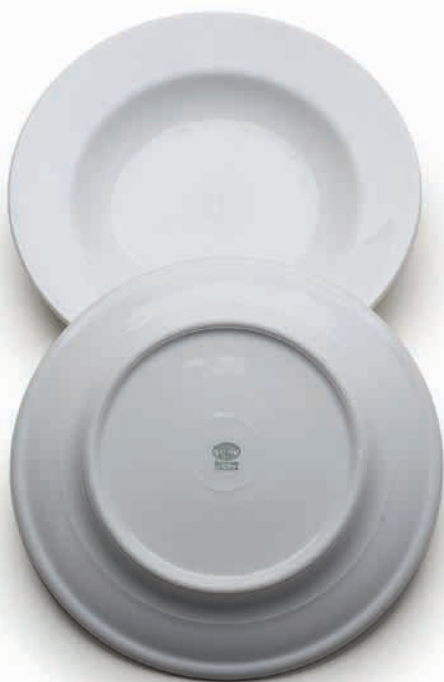
Einfache Suppenteller der Firma Bauscher in Weiden, Germany US-Zone