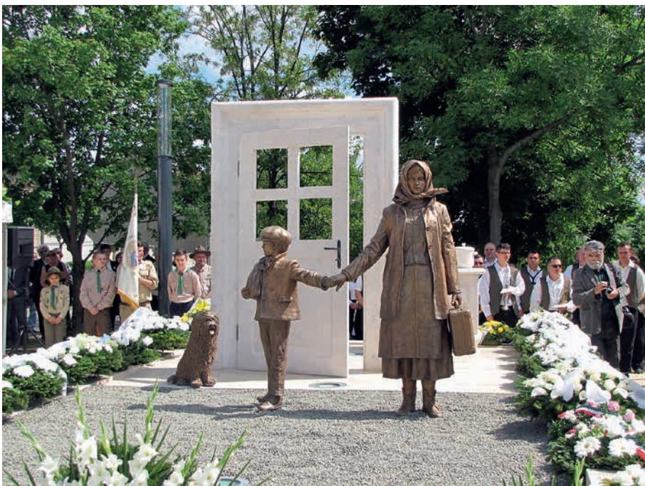
Denkmal für die vertriebenen Ungarndeutschen in Budapest-Soroksár

auf dem Sudetendeutschen Tag in Nürnberg und im Bukowina-Institut in Augsburg auf großes Interesse bei Besucherinnen und Besuchern.