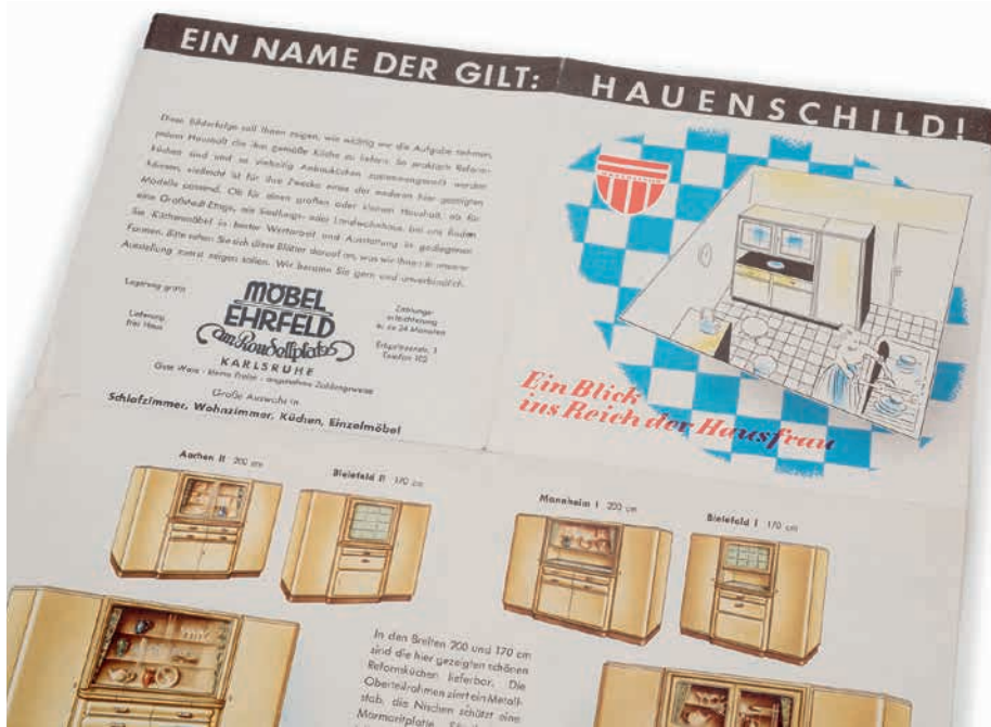
Küchenmöbel-Prospekt der Firma Hauenschild

Anfangs war eine Verwechslung der Krister Porzellanmarke mit dem Zeichen der Königlichen Porzellanmanufaktur KPM in Berlin durchaus beabsichtigt. Der senkrechte Strich über den Buchstaben, der dem berühmten Zepher der Berliner Manufaktur ähnlich sah, fand ab 1840 als Bodenmarke Verwendung. Mit wachsender Bekanntheit des Porzellans aus Waldenburg war dieser Werbetrick nicht mehr nötig und Krister Bodenmarken erhielten ihr eigenständiges Aussehen. Bereits 1936 war die Firma in das Eigentum des Rosenthal -Konzerns übergegangen. 1945 produzierte Krister in Waldenburg unter polnischer Leitung und sieben Jahre später gründete Rosenthal in Landstuhl in der Pfalz ein neues Krister Werk, das 1965 nach Marktredwitz in Oberfranken verlegt wurde. Im Jahr 1971 erlosch der Firmename. In Wałbrzych wird bis heute Gebrauchsporzellan hergestellt.