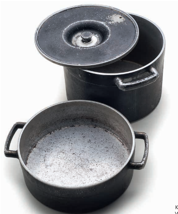
Kochgeschirr aus Waffenmaterial

Im Gegensatz zur Zeit der Rationierung von Lebensmitteln während des Krieges und danach waren die (Spät)Aussiedler mit der „Qual der Wahl“ konfrontiert und auch mit der Tatsache, dass man sich aus dem Überangebot der Waren bei Weitem nicht alles leisten konnte. Kinder und Jugendliche, die das „Andersein“ oft noch deutlich härter trifft als Erwachsene, wollten sich, wenn schon nicht in der Sprache, wenigstens in Kleidung und technischer Ausstattung mit den Gleichaltrigen in Schule und Freizeit messen können.