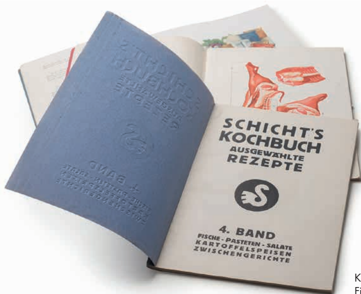
Kochbücher der Firma Schicht

Off stellten die Regeln der bundesrepublikanischen Gesellschaft die Neubürger nicht nur hinsichtlich der Versorgung mit Alltagsgütern vor große Herausforderungen. Es galt und gilt, besonders im Fall der Deutschen aus Russland, die Sprachbarriere zu überwinden und für alle, die westliche Bürokratie mit Anträgen, Fristen, Bescheiden, Verträgen, Rechten und Pflichten zu verstehen und sich selbstständig und vorausschauend um die eigenen Angelegenheiten zu kümmern. Für Menschen, die aus einem kommunistischen Staat ausgesiedelt sind, eine besondere Herausforderung.