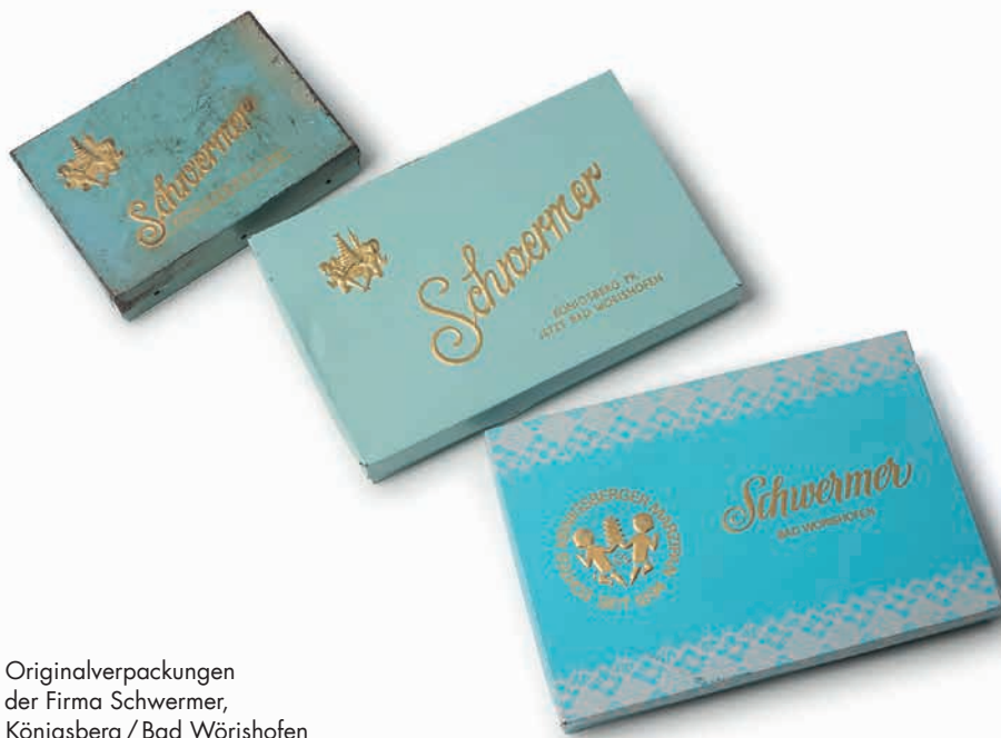
Originalverpackungen der Firma Schwermer, Königsberg / Bad Wörishofen