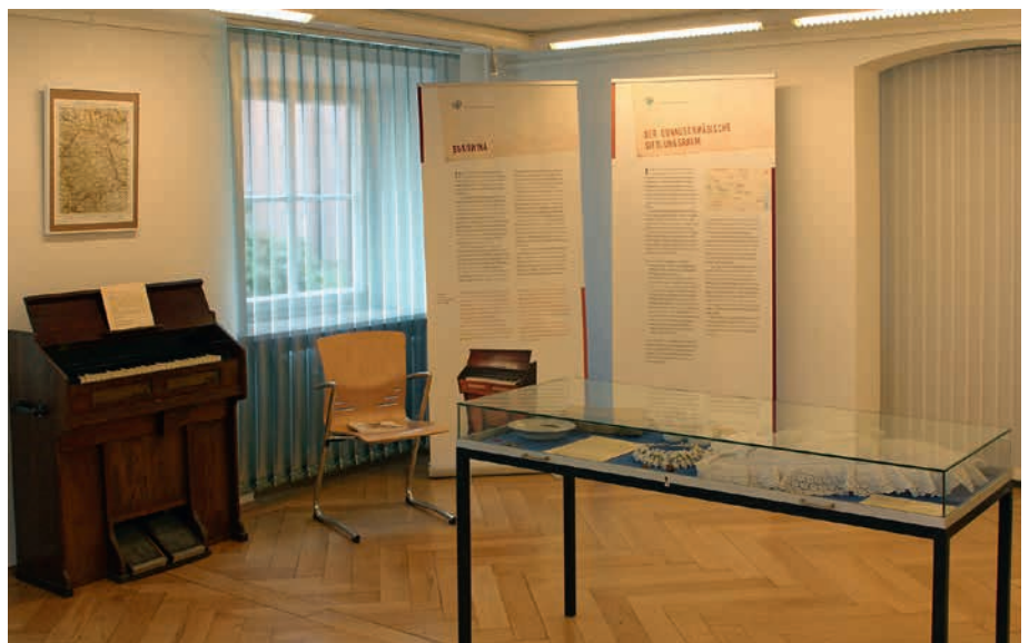
Blick in die Ausstellung mit dem Harmonium aus der Bukowina

Ergänzt wurden die „Dinge“ und die damit verbundenen individuellen Berichte durch die historische Dokumentation, die auf Roll-Ups mittels Texten und Karten für jede Region dargestellt wurde, aus der eine Leihgabe stammte. So war eine geografische und historische Reise durch Ostpreußen, Pommern, Schlesien, Böhmen und Mähren, Siebenbürgen, die Bukowina und die donauschwäbischen Siedlungsgebiete möglich. Die großen Themen der Geschichte der Deutschen des östlichen Europa wie Zwangsmigrationen und Nationalsozialismus, osteuropäisches Judentum, Flucht und Vertreibung, De-