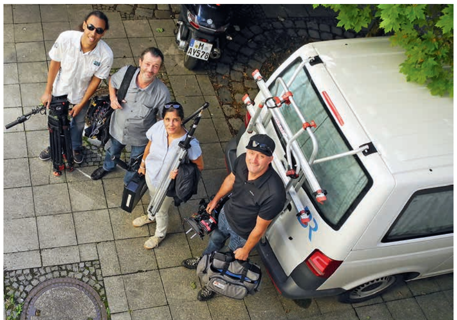
Ankunft des BR-Teams der Sendung puzzle