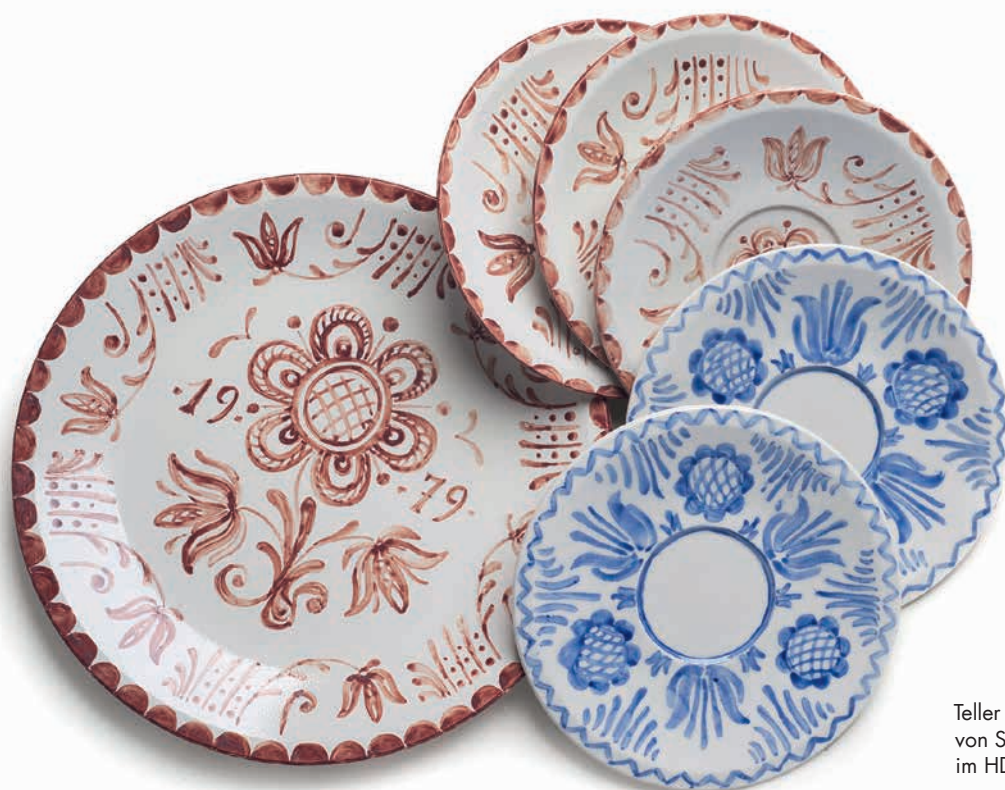
Teller aus dem Jahr 1979, von Siebenbürger Frauen im HDO bemalt