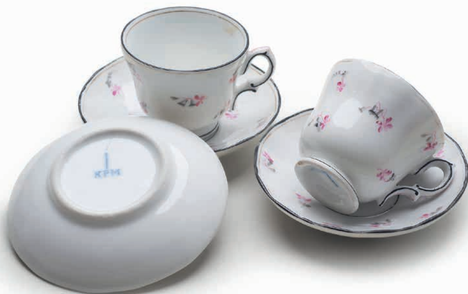
Porzellan der Firma Krister aus Waldenburg, Schlesien

Bedarf an Porzellan, Glas und Kochgeschirr. In den Jahren der Knappheit behalf man sich noch mit der Herstellung von Töpfen aus Altmetall, das oft aus Waffenmaterial bestand, und man verwendete einfache schmucklose Porzellanteller, die als Marke die Bezeichnung der jeweiligen Besatzungszone trugen, in der sie hergestellt wurden.