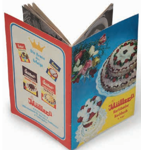
Rezeptheft der Firma Müller 5 Karlsbader aus Neutraubling