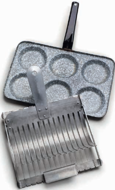
Knödelschneider und Liwanzenpfanne aus Böhmen