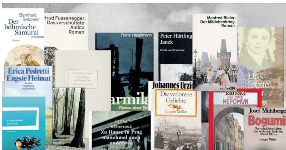
Literatur, die ganze Epochen in den böhmischen Ländern spiegelt.

Das literarische Leben im Sudetengau und im Protektorat sei mit der Etablierung der NS-Herrschaft allerdings nicht zum Erliegen gekommen. „Vielmehr fand eine intensive Förderung statt, die manchen Leser vergessen machen konnte, wer und was alles fehlte.“ Es habe Dichterlesungen, Buchausstellungen, Gaukulturwochen, Dichtertreffen, Preisverleihungen und bereits im Sommer 1939 eine Erste Großdeutsche Dichterfahrt gegeben. „Nun erfolgte die endgültige Ausklammerung mißliebiger Autoren“, und es habe eine scharfe Trennung zwischen arischen und jüdischen, zwischen demokratischen und nationalsozialistischen Autoren gegeben. „Das wirksamste Mittel dafür waren die Förder- und Verbotslisten der nationalsozialistischen Kulturpolitik.“