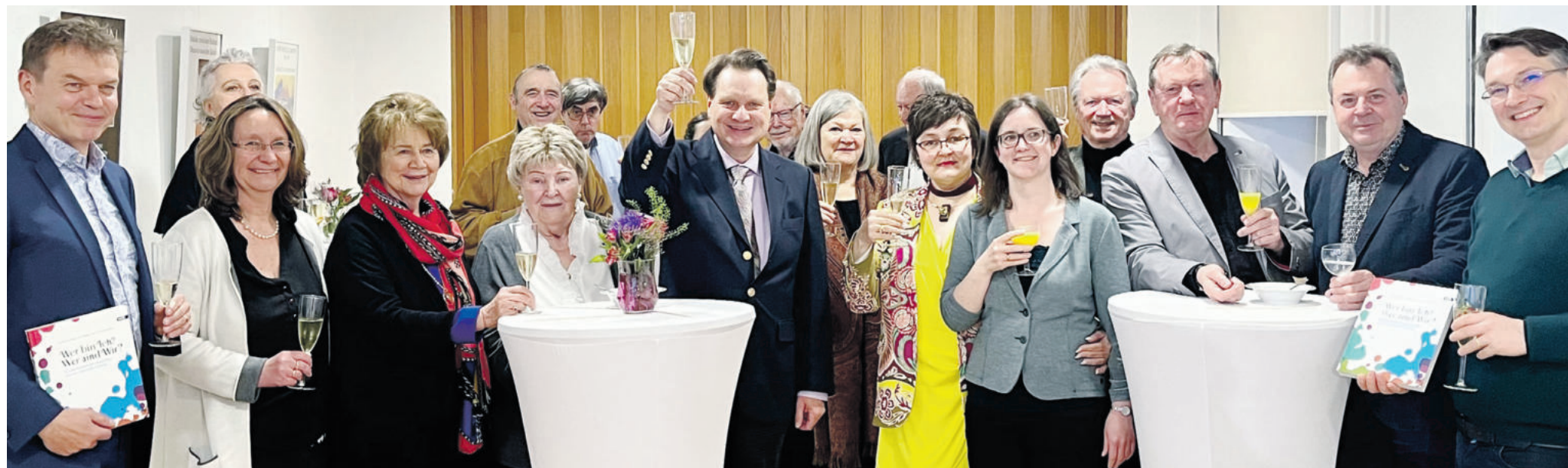
„Buchtaufe“ mit einem Gläschen Sekt im Haus des Deutschen Ostens in München.