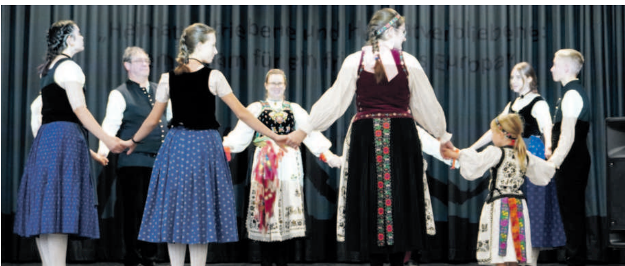
Eine gemischte Kindertanzgruppe aus Siebenbürger Sachsen und Banater Schwaben zeigt schöne Tänze.