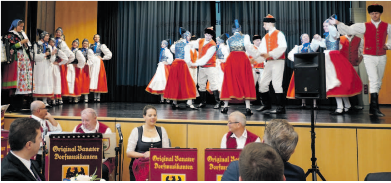
Ein Höhepunkt ist der Auftritt der pommerschen Tanz- und Späldeel Leba Erlangen mit verschiedenen Tänzen, darunter ein Erntetanz und der beliebte „Krawowiak“.