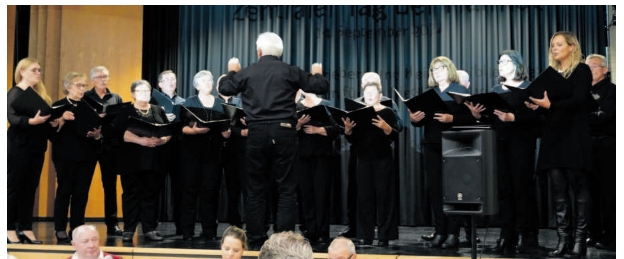
Die Donauschwäbische Singgruppe Landshut singt „Wenn der Wein blüht“.