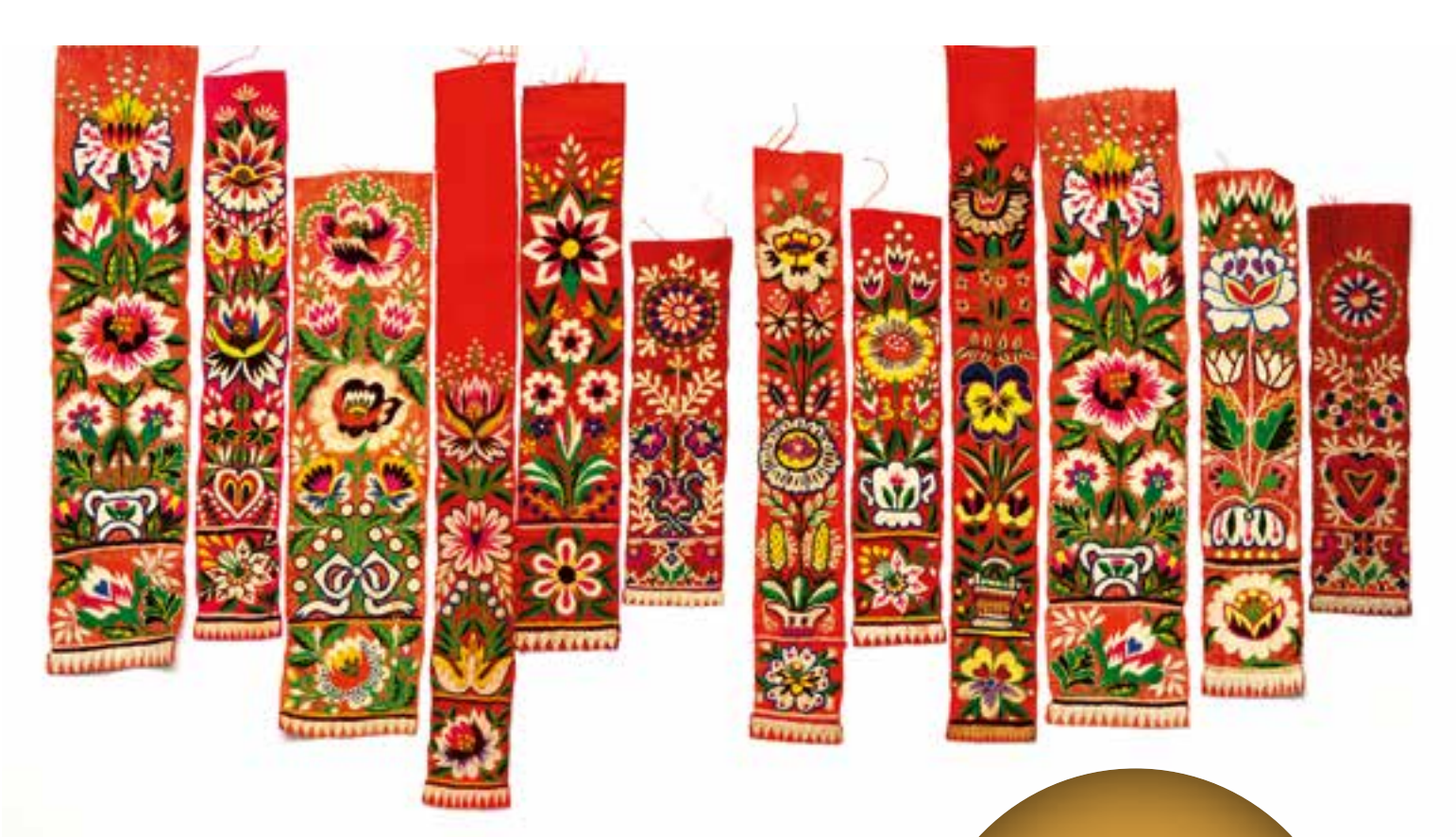
schürze / Fürsteck, Festtracht der Frauen, Wischauer Sprachinsel, Südmähren / Tschechien (Leihgeberin: Rosina Reim)

Variabel gestaltbar – ideal für unterschiedlichste Raumgrößen!