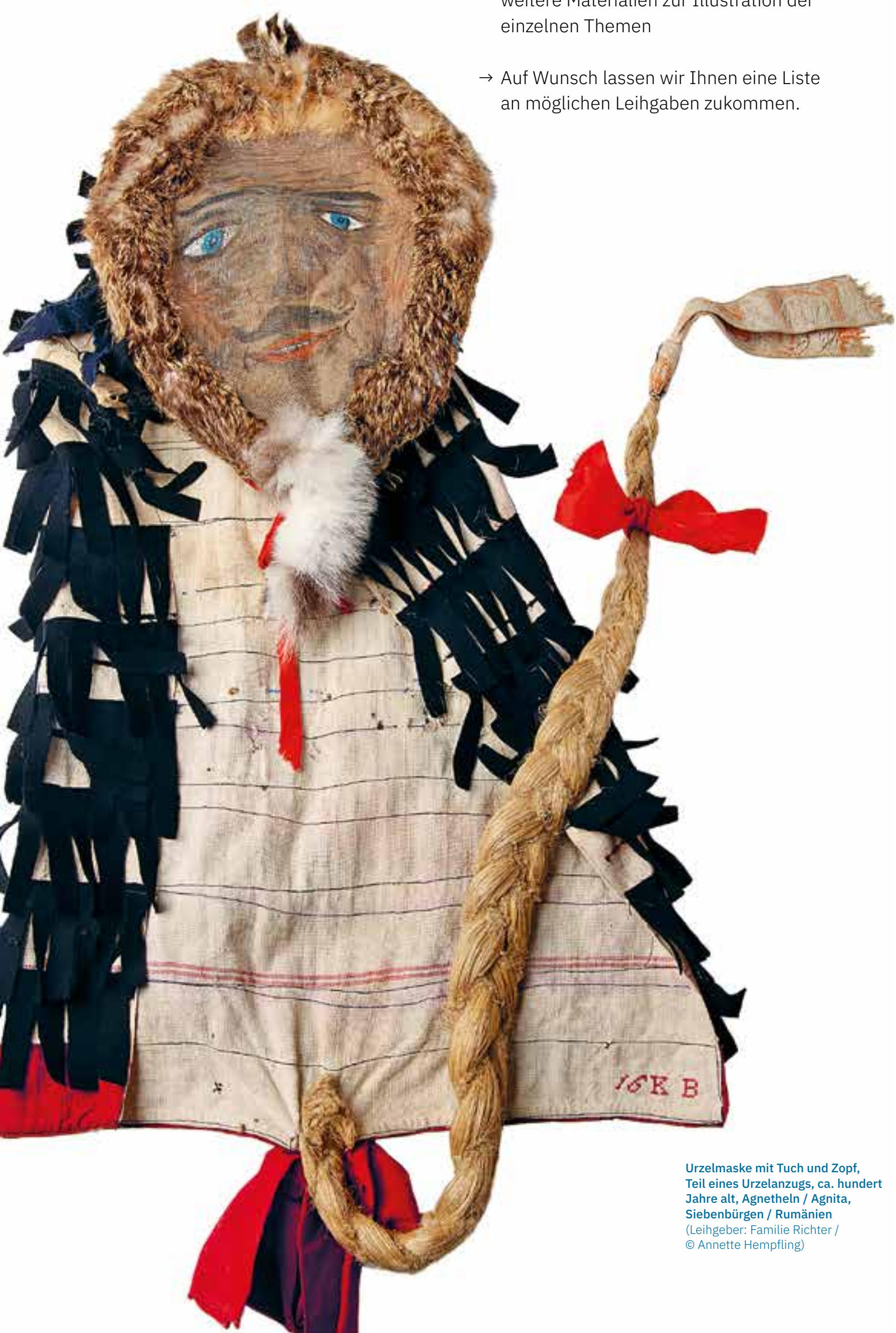
Urzelmaske mit Tuch und Zopf, Teil eines Urzelanzugs, ca. hundert Jahre alt, Agnetheln / Agnita, Siebenbürgen / Rumänien (Leihgeber: Familie Richter)

Ausstellungsobjekte auf Wunsch inklusive – für ein authentisches Erlebnis!