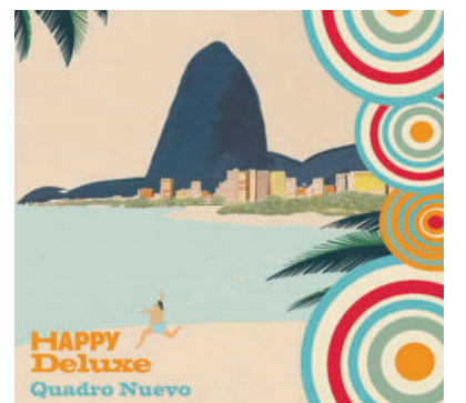
CD Quadro Nuevo: „Happy Deluxe“. 17,00 Euro. Bestellbar unter https://quadronuevo.de/music-shop-glm/

Die Musik von Quadro Nuevo strahlt die Lust am abenteuerreichen Leben aus. Jede Melodie erzählt davon. Jeder Ton gibt die tiefe Liebe zum Instrument wieder. Jede Reise prägt die extravagante Musizierkunst des Ensembles. la/sh