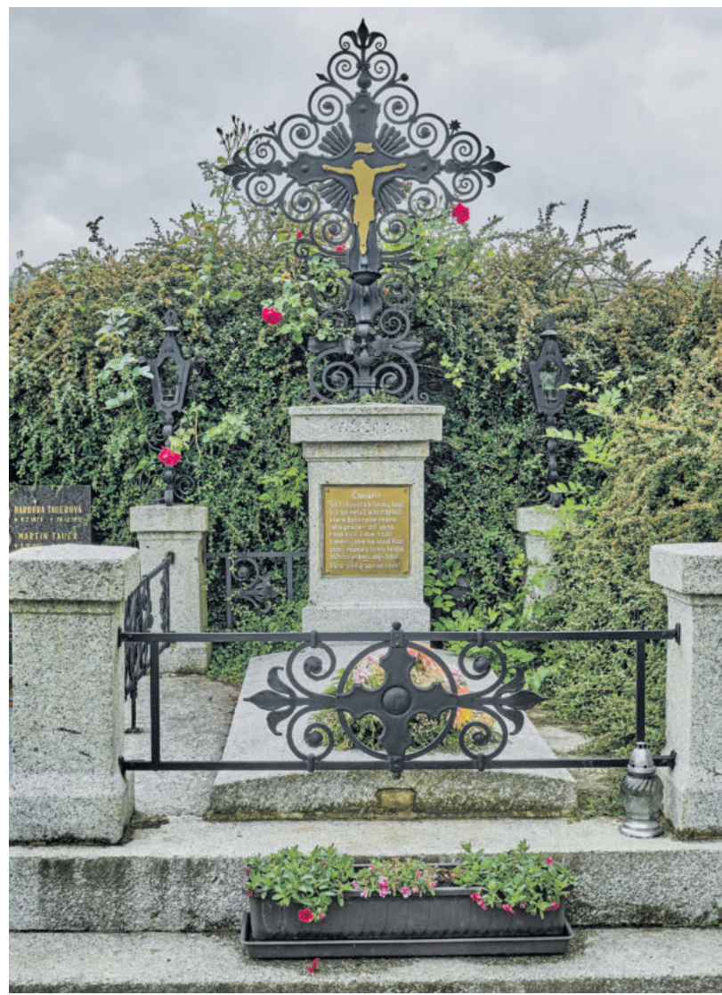
Jindřich Šimon Baars Grabmal in Klentsch.

Die Erzählung „Pro kravičku“ beschreibt das Schicksal des