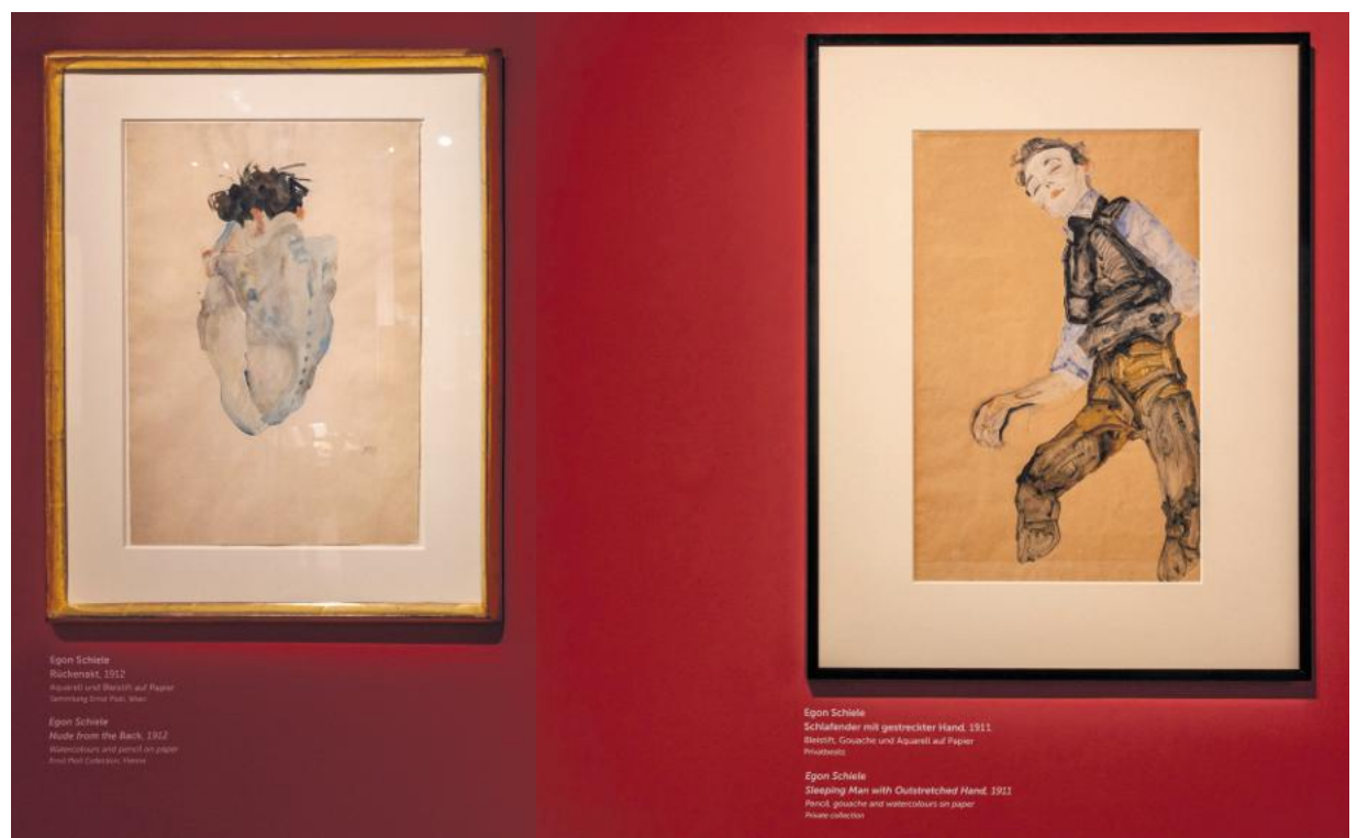
Egon Schieles „Rückenakt“ (1912) und „Schlafender mit ausgestreckter Hand“ (1911).