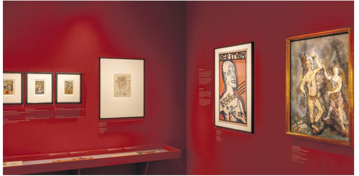
In der Schatzkammer (2026).