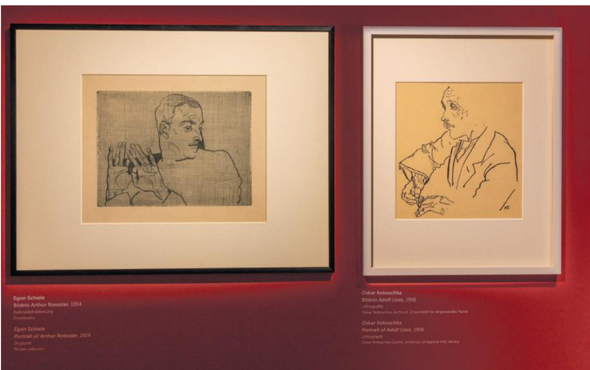
Egon Schieles „Bildnis Arthur Roessler“ (1914) und Oskar Kokoschkas „Bildnis Adolf Loos“ (1916).

Bis Sonntag, 1. November: „Egon Schiele und Oskar Kokoschka. Rivalen“ in Tulln an der Donau, Egon-Schiele-Museum, Donaulände 28, Internet www.schielemuseum.at , Dienstag bis Sonntag 10.00 – 17.00 Uhr, Eintritt 6, ermäßigt 5, Kinder 3,50 Euro.